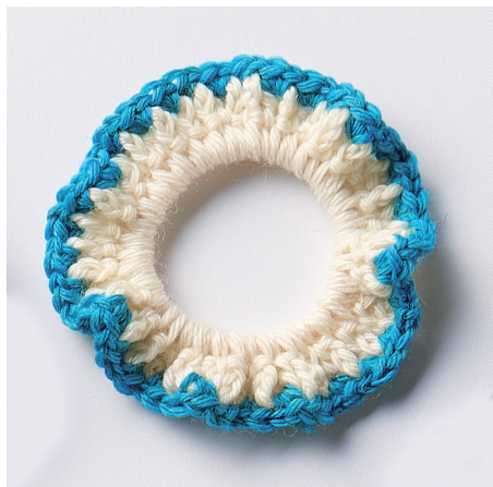
デザイン/クロバー 出来上がりサイズ：直径約 9cm