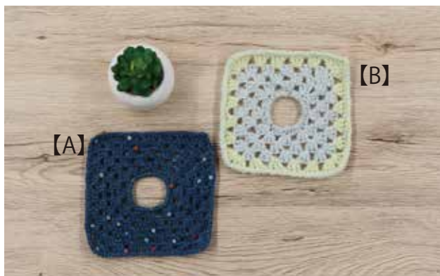
デザイン/クロバー